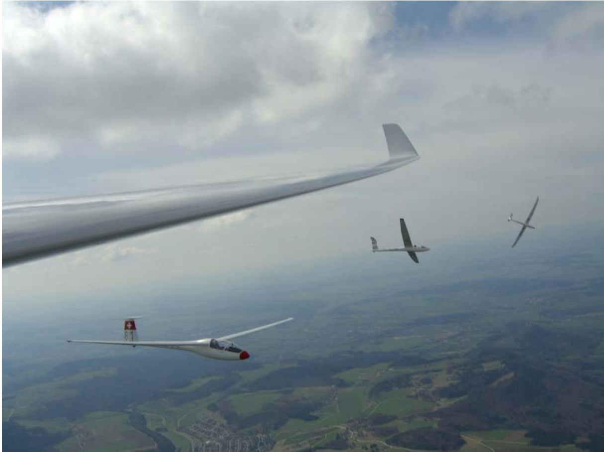
Fototermin über der Schwäbischen Alb.