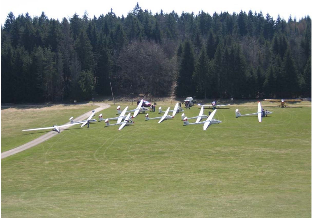
Die gesamte Flotte vor dem Start in Klippeneck.