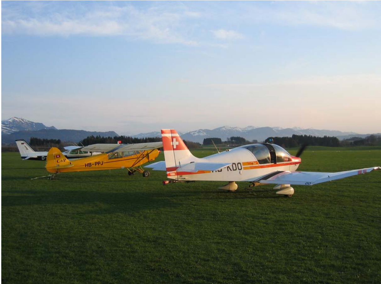
Die Schleppmaschinen bei ihrem Zwischenhalt in Kempten.

Der Flug beginnt mittags mit guten Steigwerten über der Klippe. Wenige Kilometer weiter, in der Donaunähe finden wir die Thermik nicht mehr so einfach. Deshalb erwischt es auch drei Segelflugzeuge, die zu einer Zwischenlandung gezwungen werden. Unsere Schleppmaschinen, noch in Klippeneck, werden per Funk angefordert, um die Gelandeten wieder auf Kurs zu bringen.