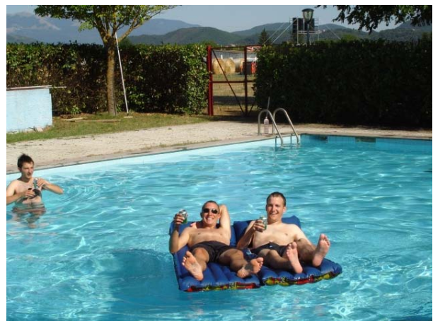
und auch am Boden wird gemeinsam entspannt!